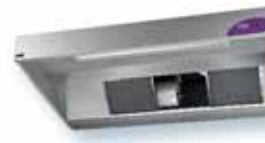
VORAX® PREMIUM G