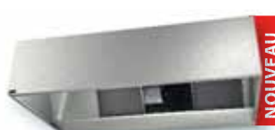
VORAX® BASIC / VORAX® BASIC G Statique / Dynamique