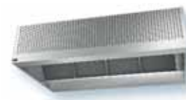
VORAX® CONFORT 90/10