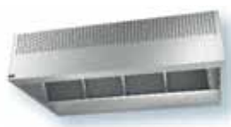
VORAX® INDUCT/INDUCT PLUS